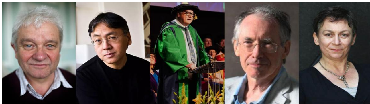
生物化学家、2001 诺贝尔生物或医学奖获得者 Sir Paul M. Nurse 2017 诺贝尔文学奖获得者、1989 布克奖获得者 黑石一雄 2020 诺贝尔生物或医学奖获得者 Michael Houghton 1998 布克奖获得者 Ian McEwan 1998 布克奖获得者 Anne Enright